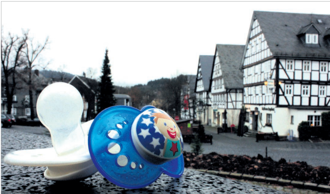
Die Hilchenbacher Geburtenzahlen bleiben alarmierend gering: Schätzungsweise 84 Kinder wurden 2011 gemeldet – ein verfestigter Trend, der Auswirkungen haben dürfte.